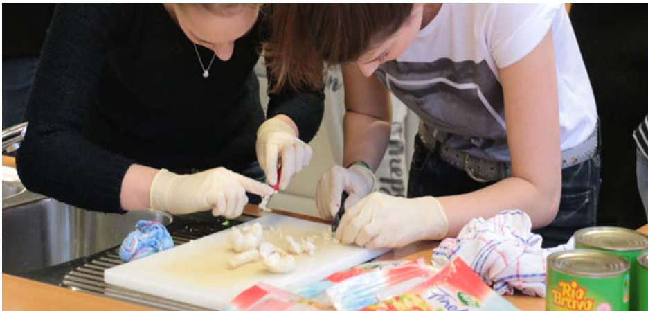
› Unterricht im Berufsfeld Hauswirtschaft

Entstehende Fahrtkosten werden ab einem Schulweg von mehr als 5 km erstattet. Weitere Informationen hierzu sind im Schulbüro des Berufskollegs Bocholt-West zu erhalten