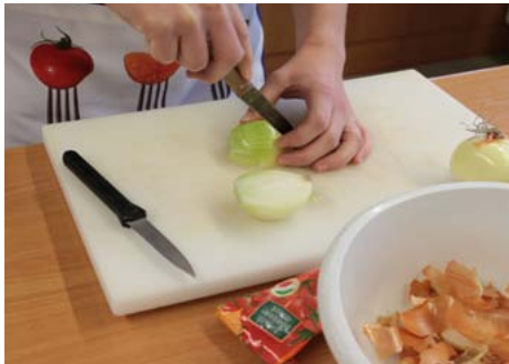
› Unterricht im Berufsfeld Hauswirtschaft