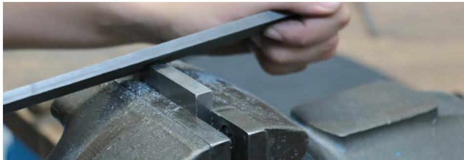
› Unterricht im Berufsfeld Metalltechnik